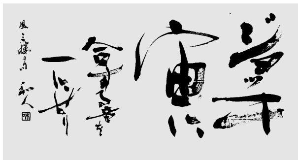
条幅随意半折½横の部