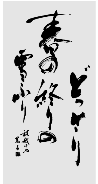
条幅随意半折1/2の部