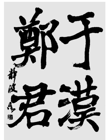
半紙随意(臨書)の部